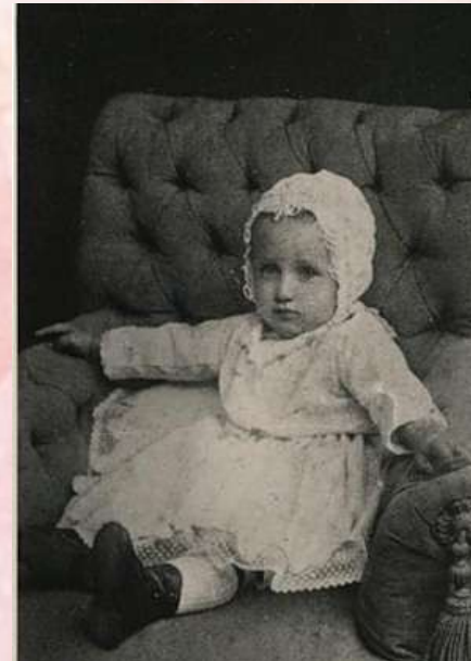
А. Ахматова в детстве