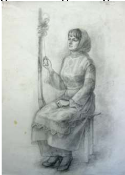
Рисунок фигуры натурщика или натурщицы в русском народном костюме

Вводная беседа и постановка задач: изучение взаимодействия тона лица, головного убора, одежды и фона с помощью светотональных отношений. Развитие чувство пластического взаимодействия формы. Анализ работ из метод. фонда. Выполнение эскизов. Поиск композиции, а также основных тональных и цветовых отношений. Решение тональных отношений в постановке. Определение тонального масштаба в рисунке. Выполнение линейно-конструктивного построения. Точно определяются пропорций и пластических особенностей всех элементов фигуры. Поиск основных тональных отношений (фигуры, фона, одежды). Объемно-пластическое и тональное построение формы всех элементов фигуры. Моделирование формы, прорабатываются детали. Достижение портретного сходства модели. Обобщается тоновое решение постановки для достижения целостности изображения.