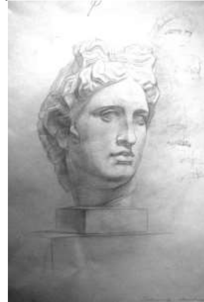
Рисунок гипсовой головы Аполлона

Вводная беседа и постановка задач: выявить пластические и анатомические особенности античной головы, дальнейшее изучение конструкции и характера головы человека. Анализ работ из метод. фонда.