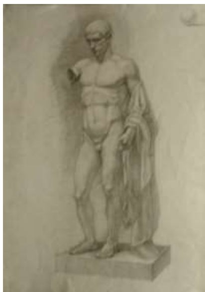
Рисунок статуи Германика

Вводная беседа и постановка задач: выявить пластические и анатомические особенности гипсовой фигуры человека, изучение анатомического и пластического строения фигуры. Анализ работ из метод. фонда.