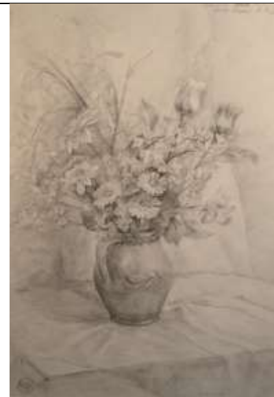
Рисунок натюрморта из 3 предметов различных фактур и 2 драпировок мягкими рисовальными материалами

Вводная беседа и постановка задач: изучение приемов и методов рисования растительных мотивов . Анализ работ из метод. фонда. Постановка и формулировка конкретной учебной задачи и содержания предстоящего учебного задания, а также определение условий, требований и критериев оценки конечного результата.