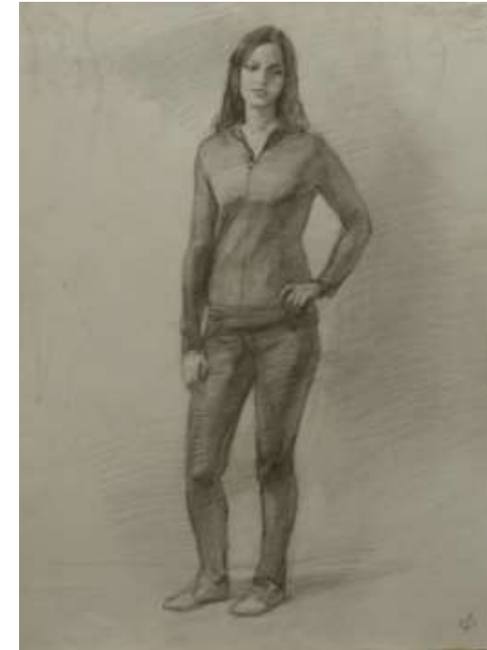
Рисунок стоящей фигуры натурщицы

Вводная, обзорная лекция. Значение выполнения рисунок фигуры живой модели в одежде в обучении будущих художников традиционного прикладного искусства по видам. Правила постановки фигуры человека в контрапосте. Принципы конструктивного, анатомического, пластического изображения фигуры человека. Принципы композиционного решения рисунка стоящей фигуры. Определение пропорциональных отношений в фигуре человека. Конструктивное построение стоящей фигуры. Тональное решение изображения фигуры живой модели. Проверка пропорций и