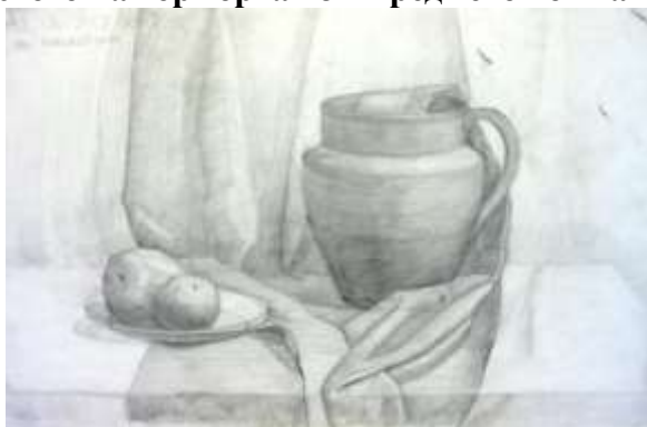
Рисунок простого натюрморта из 2 предметов быта и драпировки

Вводная беседа и постановка задач: скомпоновать композицию, верно построить предметы, передать объем светотенью и определить тональные отношения, точно изобразить переходы полутонов, анализ работ из метод. фонда.