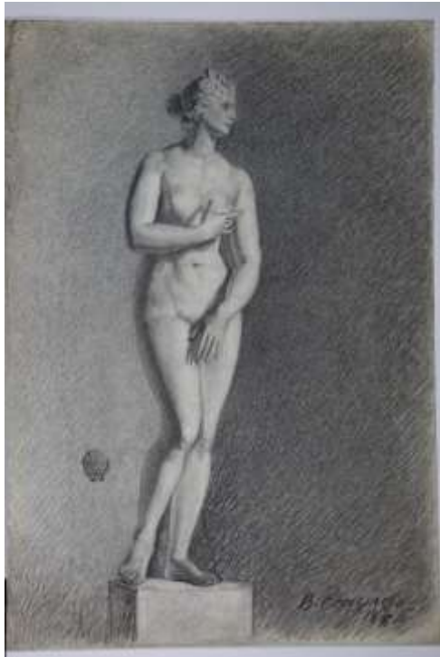
Рисунок статуи Венеры Медицейской

Вводная, обзорная лекция. На лекции рассматриваются вопросы: Значение рисования гипсовой фигуры античного слепка в обучении будущих художников традиционного прикладного искусства по видам. Правила постановки женской фигуры в сложном движении. Принципы конструктивного, анатомического, пластического изображения женской фигуры. Принципы композиционного решения изображения античной фигуры. Определение пропорциональных отношений в женской фигуре. Конструктивное построение стоящей фигуры. Светотеневое решение изображения античной фигуры. Проверка