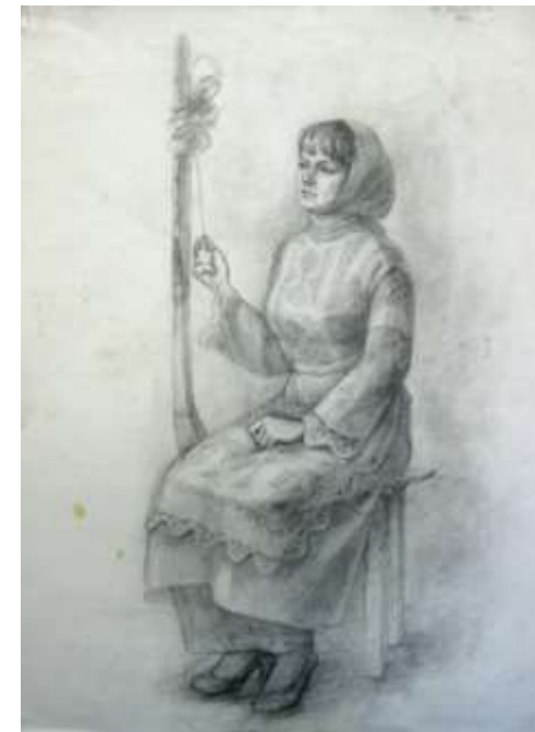
Рисунок фигуры натурщика или натурщицы в русском народном костюме

Вводная беседа и постановка задач: изучение взаимодействия тона лица, головного убора, одежды и фона с помощью светотональных отношений. Развитие чувство пластического взаимодействия формы. Анализ работ из метод. фонда.