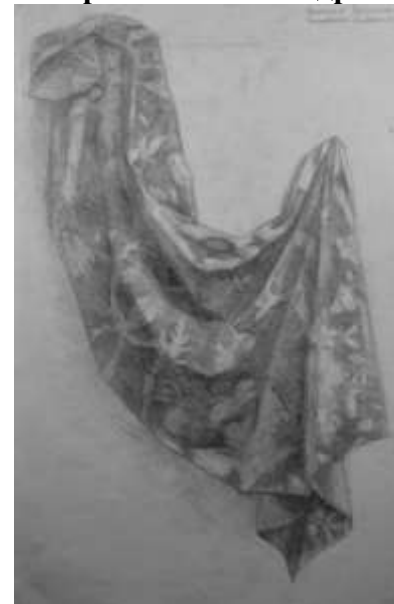
Рисунок орнаментальной драпировки

Вводная беседа и постановка задач: совершенствование рисовальной техники, изучение влияния орнамента на визуальное восприятие формы и конструкции, передача единого тонального состояния натуры, анализ работ из метод. фонда.