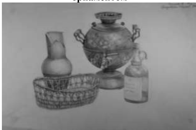
Рисунок отдельных предметов быта ХII, декорированных орнаментом

Вводная беседа и постановка задач: скомпоновать композицию, верно построить предметы, передать объем светотенью и определить тональные отношения, точно изобразить переходы полутонов, анализ работ из метод. фонда.