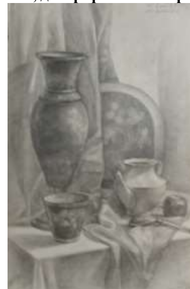
Рисунок натюрморта с включением предметов быта НХП и драпировок, декорированных орнаментом.

Вводная беседа и постановка задач: скомпоновать композицию, верно построить предметы, передать объем светотенью и определить тональные отношения, точно изобразить переходы полутонов, анализ работ из метод. фонда.