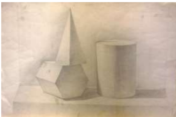
Рисунок простого натюрморта из 3 геометрических тел и драпировки

Вводная беседа и постановка задач: скомпоновать композицию, верно построить предметы, передать объем светотенью и определение тональных отношений, точно изобразить переходы полутонов, анализ работ из метод. фонда.