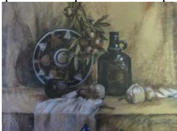
Рисунок натюрморта из 3 предметов различных фактур и 2 драпировок мягкими рисовальными материалами

Вводная беседа и постановка задач: скомпоновать композицию, верно построить предметы, передать объем светотенью и определить тональные отношения, точно изобразить переходы полутонов, анализ работ из метод. фонда.