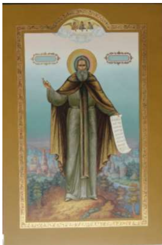
Пейзажная икона «Святой Сергий Радонежский»