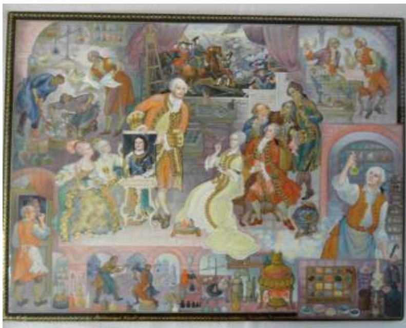
Проект выполненный в материале (на пластине из папье-маше)